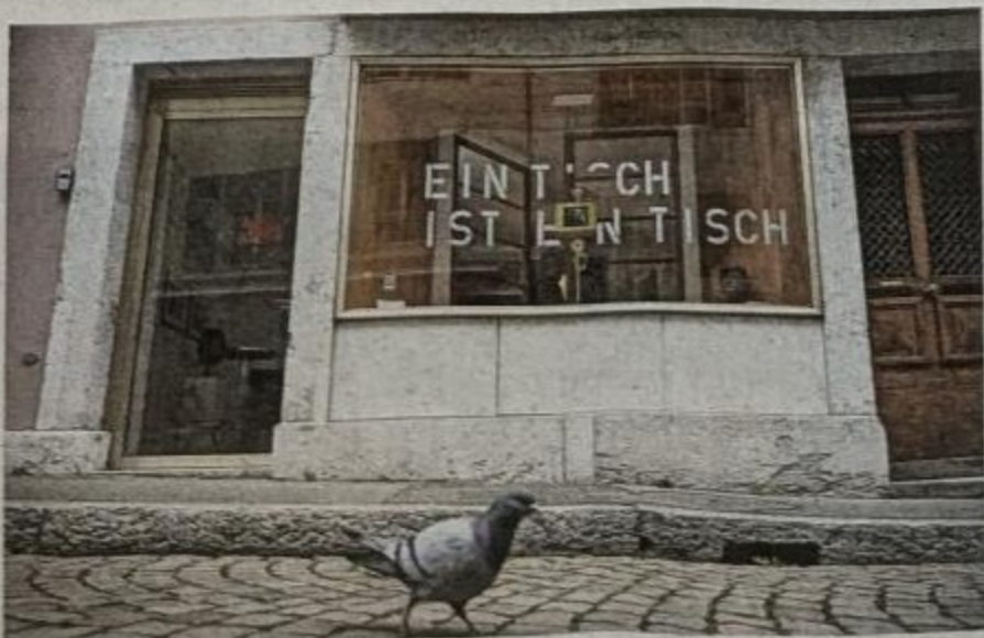
Das Büro Bichsel liegt an der Schaalgasse in Solothurn. Bichsel selber arbeitete früher nur wenige Meter entfernt an der Hauptgasse.

Ausstellung: «Weiterdenken mit Peter Bichsel» in der Bibliothek Oberaargau, Herzogenbuchsee. Vernissage: 18. April, 10:30 Uhr. Weiteres Programm unter www.b-oa.ch/veranstaltungen . Bis 9. Mai 2026.