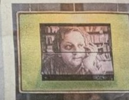
Im Schaufenster raucht Peter Bichsel weiter.

viel auslöst.» Und darum gehe es weniger um den Menschen Bichsel («das fände er peinlich»), mehr um seine Gedanken, die immer auch ein Spiegel seiner Mitmenschen und der Gesellschaft waren.