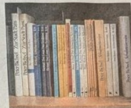
Auch seine Bücher können hier gelesen werden.